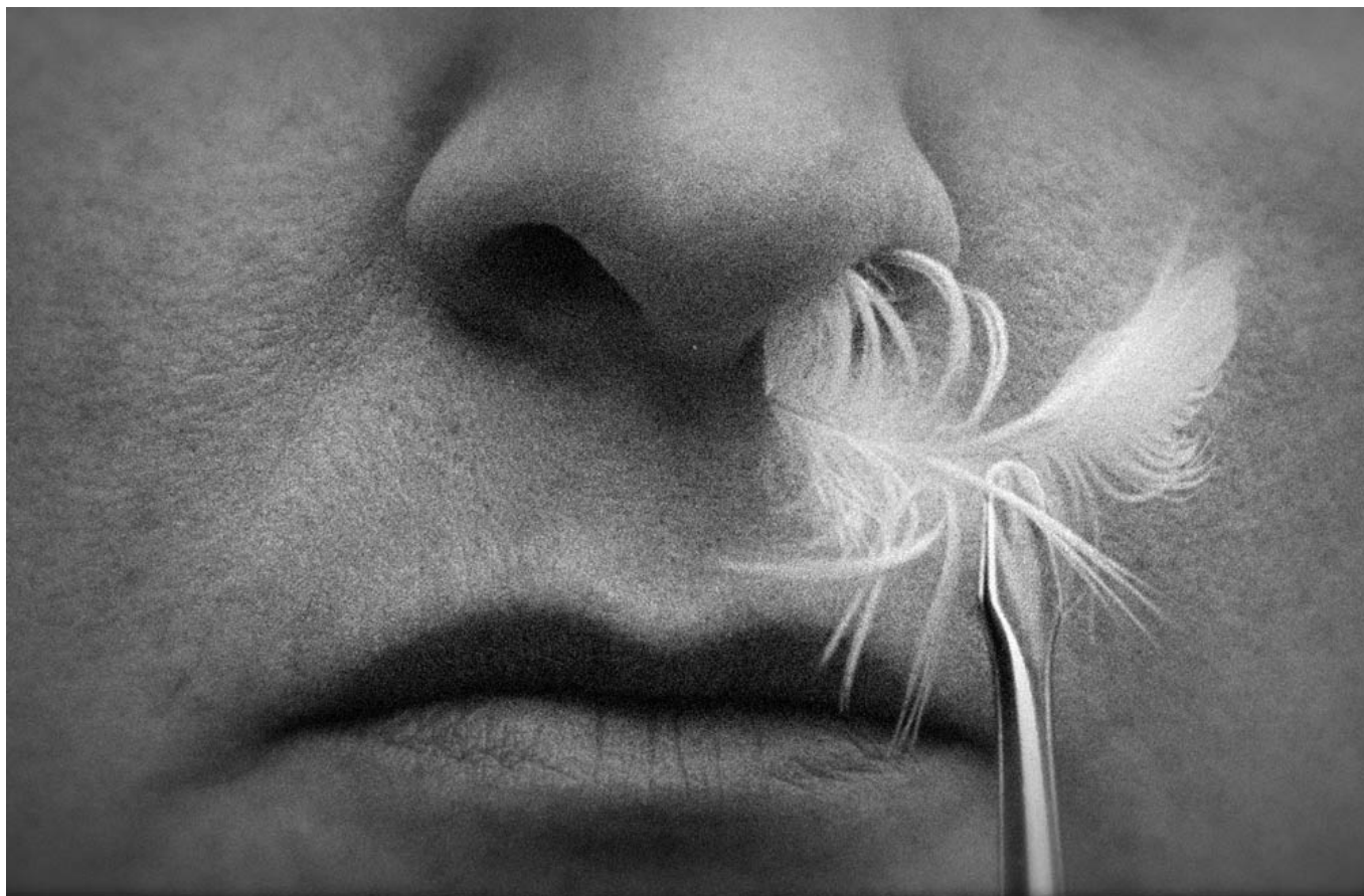
Stillkuva teoksesta Eläinsilta U3033 (2018).